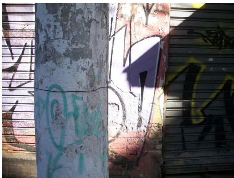
Fotografia Rosário, Cíntia Corona, 2013.