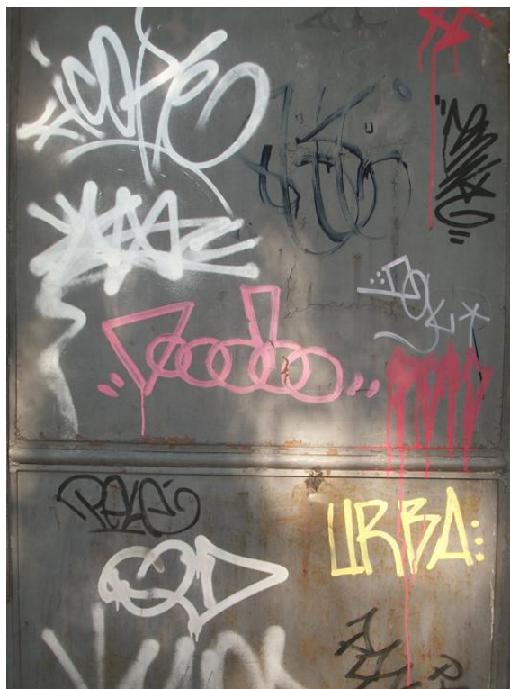
Fotografia Pezão, Cíntia Corona, 2013.