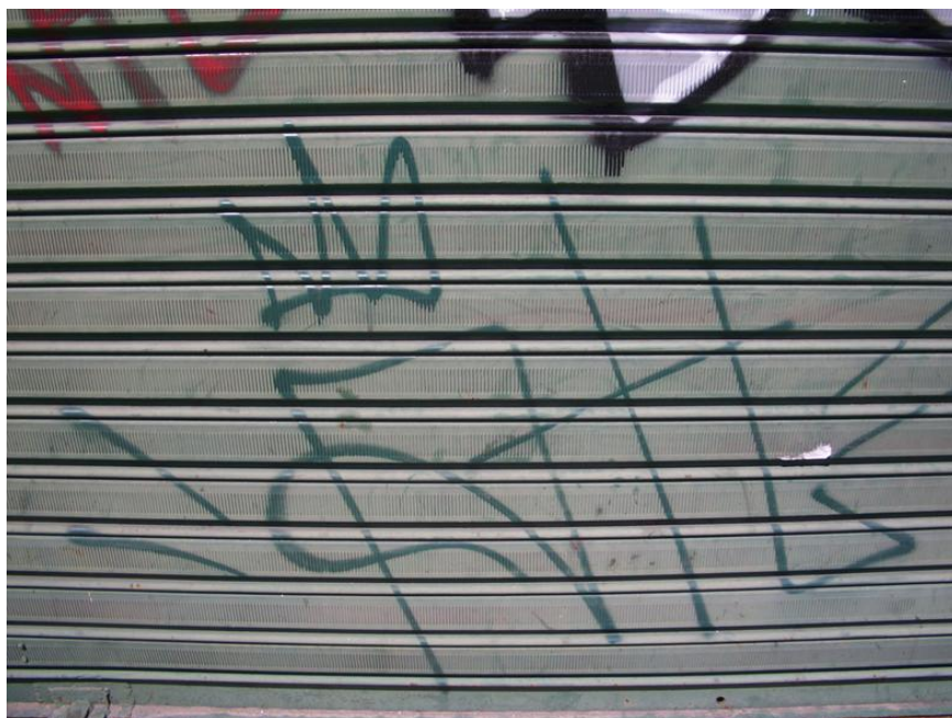
Fotografia Atl , Cíntia Corona, 2013.