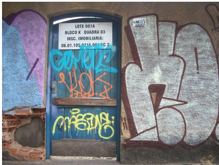
Fotografia nº1309, Cíntia Corona, 2013.