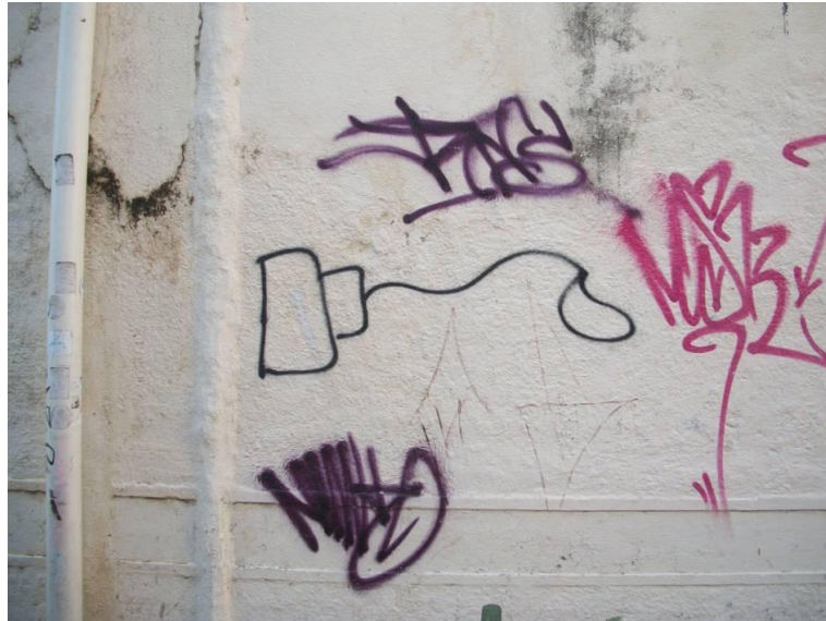
Fotografia Spray, Cíntia Corona, 2013.