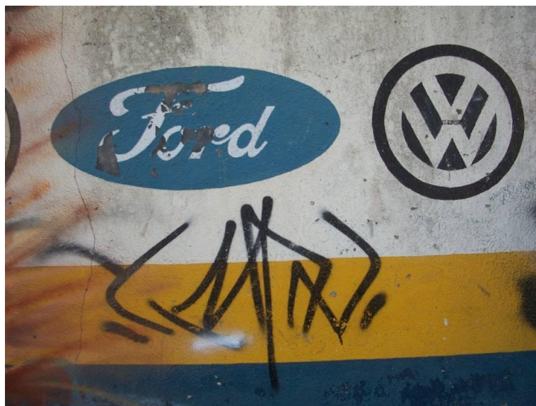
Fotografia Ford, Cíntia Corona, 2013.