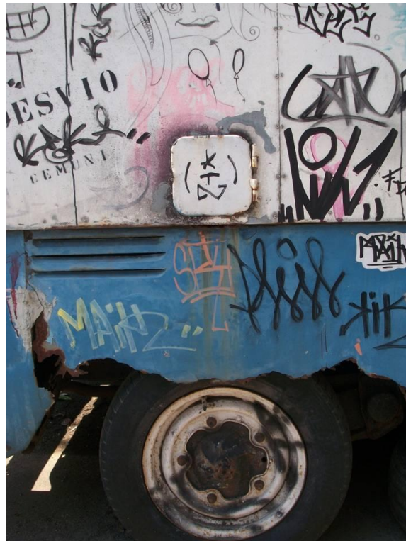
Fotografia Hebe, Cíntia Corona, 2013.