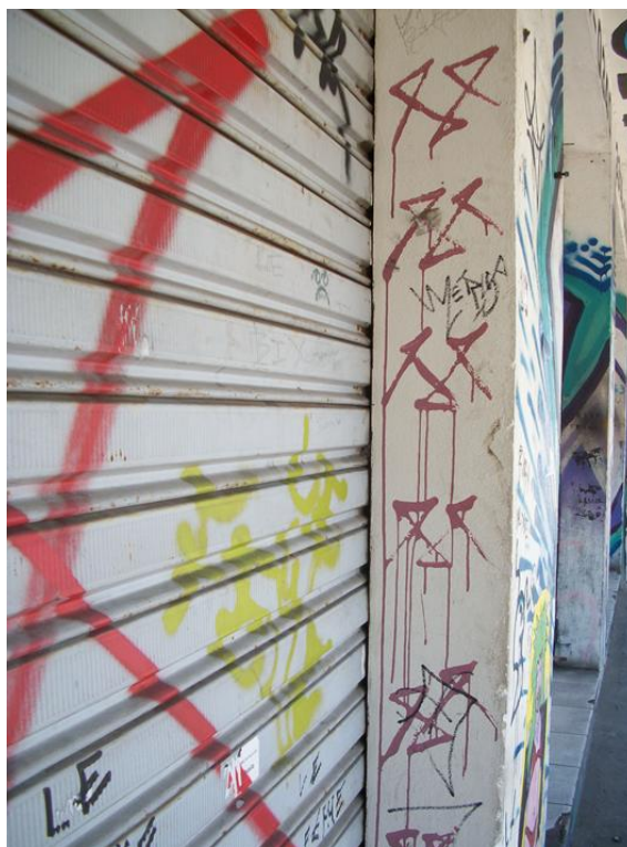
Fotografia Mérus, Cíntia Corona, 2013.