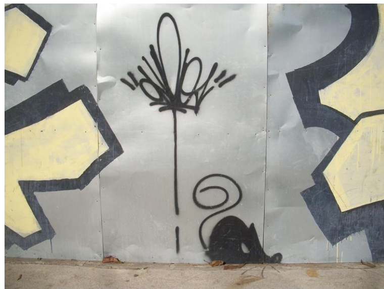
Fotografia Ratos, Cíntia Corona, 2013.