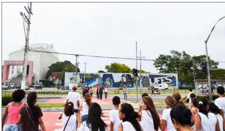
Figura 16: Mural da UFES e seu entorno (2012).