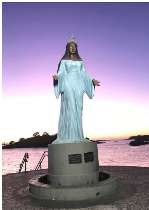
Figura 9: Imagem do monumento em 2020.