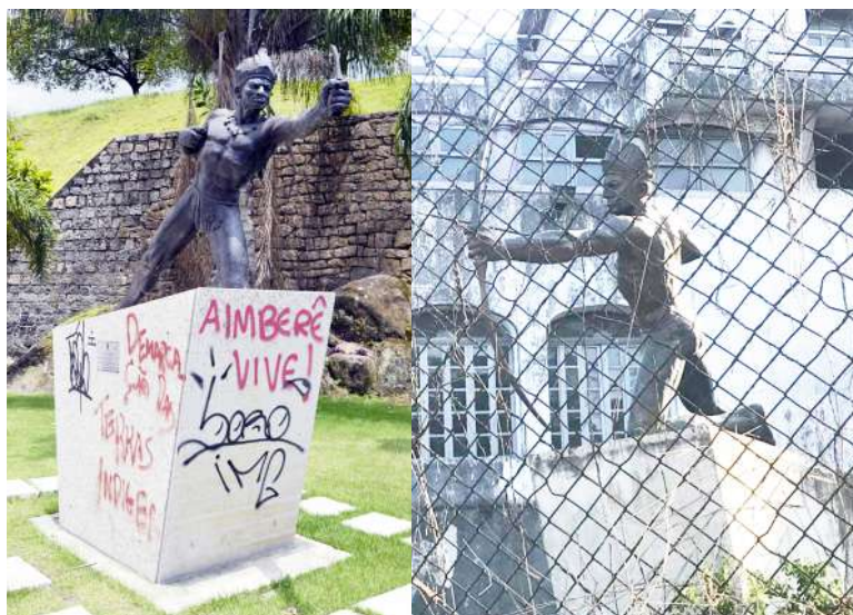
Figuras 6a e 6b: Monumento ao Índio Araribóia. Imagens de sua instalação fora (2015) e dentro (2020) do Clube Saldanha da Gama.