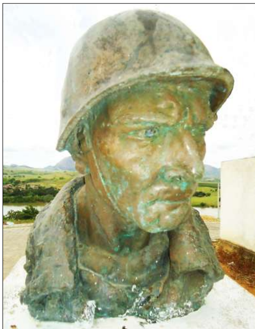
Figura 3: Busto de Aldomário Falcão (1976). Baixo Guandu (ES).