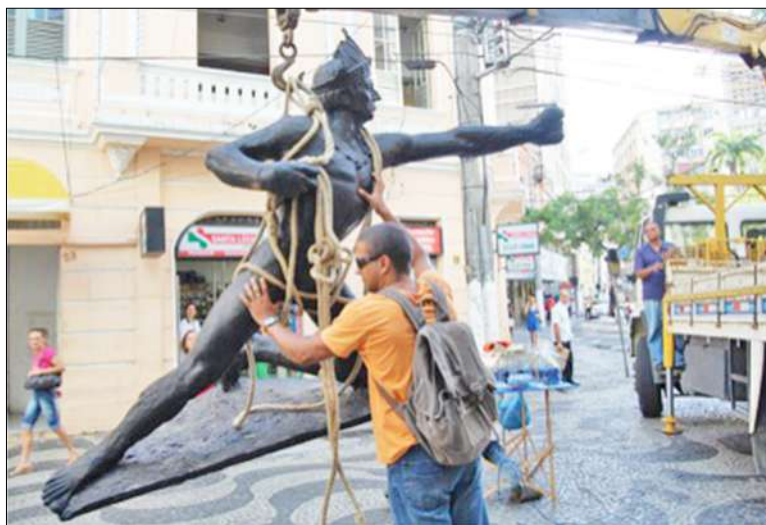
Figura 7: O retorno do Araribóia – Coletivo Maruípe. Intervenção Urbana. Centro de Vitória/ES, Brasil. 2008.