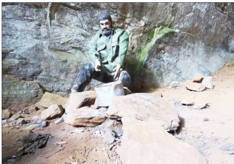
Figura 13: Guerrilheiro no interior da gruta de São Quirino, Irupi-ES.