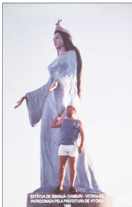
Figura 8: Cartão Postal do monumento instalado no píer da Praia de Camburi com o artista.