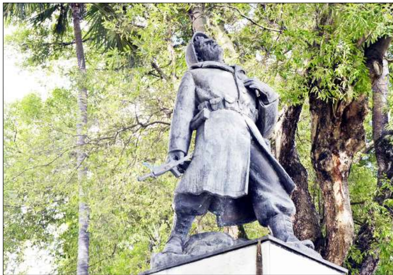
Figura 1: Monumentos Aos expedicionários (1951). Centro de Vitória.