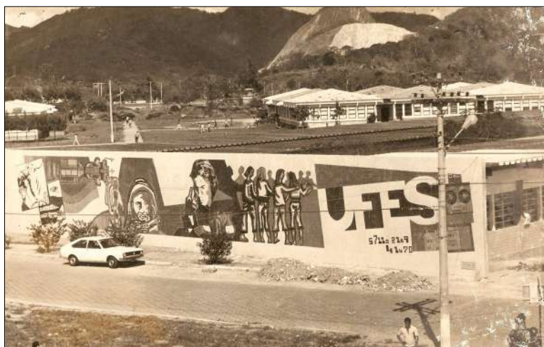
Figura 15: Mural da UFES na empena cega do prédio administrativo. Ao fundo se vê os CEMUNI's e seu entorno na década de 1970.