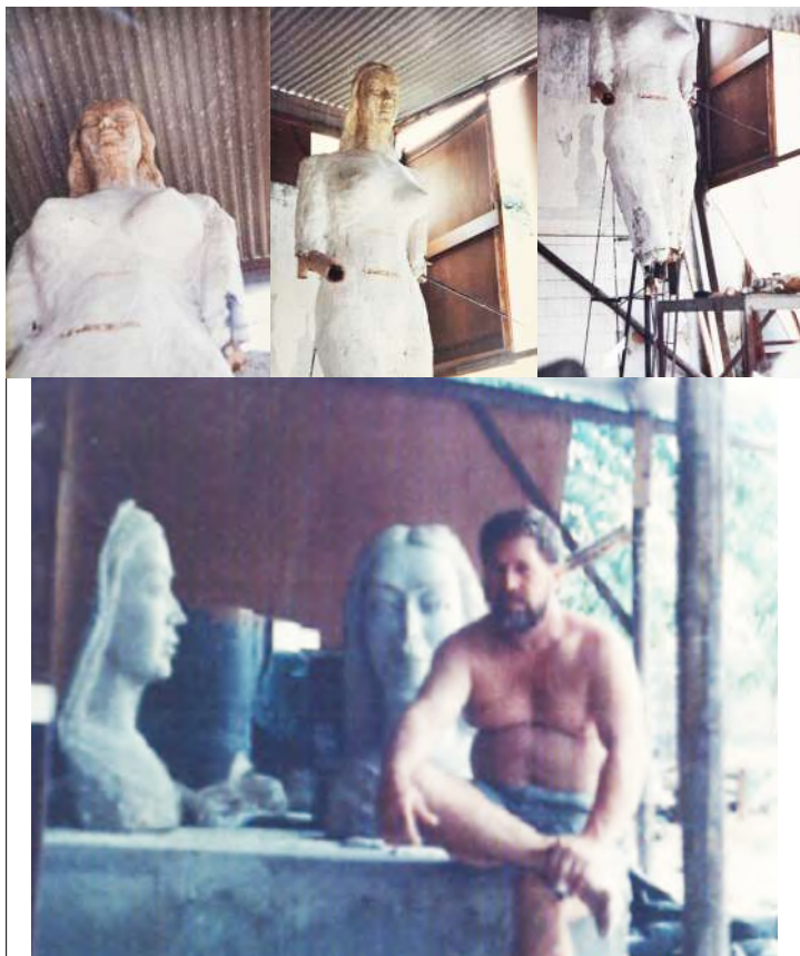
Figuras 10a, 10b, 10c e 10d: Imagens do processo de elaboração do Monumento à Yemanjá.