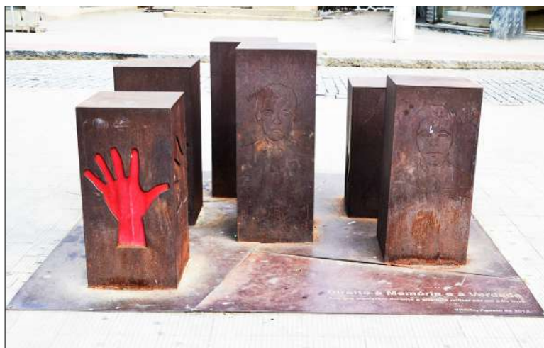
Figura 2: Pessoas Imprescindíveis (2012).