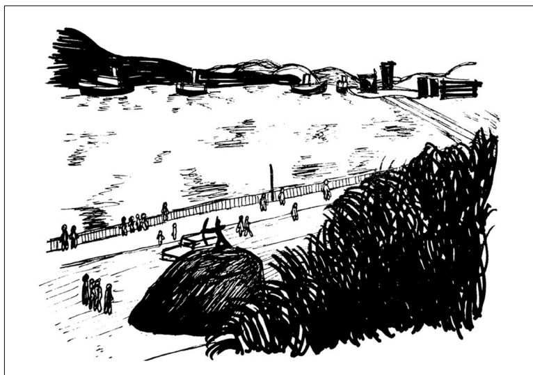
Figura 4: Representação gráfica da instalação do Monumento ao Índio Arari-bóia, visto do Morro do Forte. Croqui feito a partir do acervo do Instituto Jones dos Santos Neves. Observa-se que a esplanada já sofreu um primeiro aterro e o monumento já não se encontra mais na água como inicialmente instalado.

Desenho de Douglas Gomes, 2020