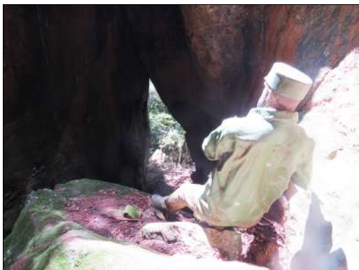
Figuras 12a, 12b e 12c: Guerrilheiro na entrada da gruta de São Quirino, Irupi-ES.