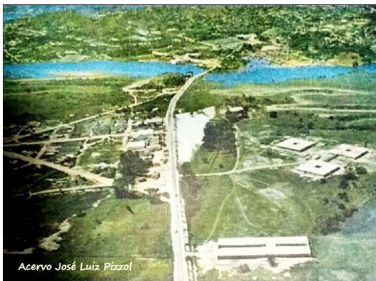
Figura 14: Vitória, início de 1969. Avenida Fernando Ferrari, com os módulos da UFES recém-construídos, à direita; trecho de Jardim da Penha à esquerda; o Canal de Camburi, ao fundo, com a Ponte da Passagem e o prédio administrativo na parte de baixo da imagem.