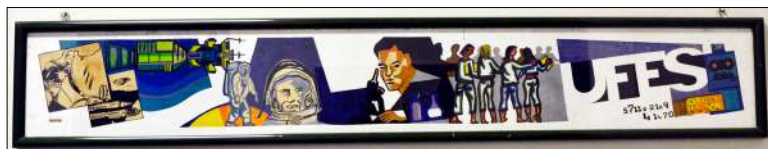
Figura 17: Raphael Samú. Projeto de execução do mural (1974). Tinta guache sobre papel. Cerca de 30 cm x 130 cm.